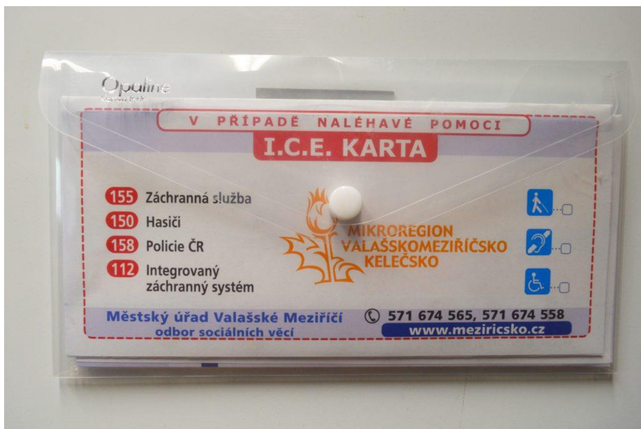
I.C.E. karta poskládaná do plastové obálky.

I.C.E. kartu přeložte na třetiny a vložte do plastové obálky tak, aby byla vidět třetina zadní strany s výrazným nápisem I.C.E. karta. Poté obálku připevněte na kovový povrch lednice.